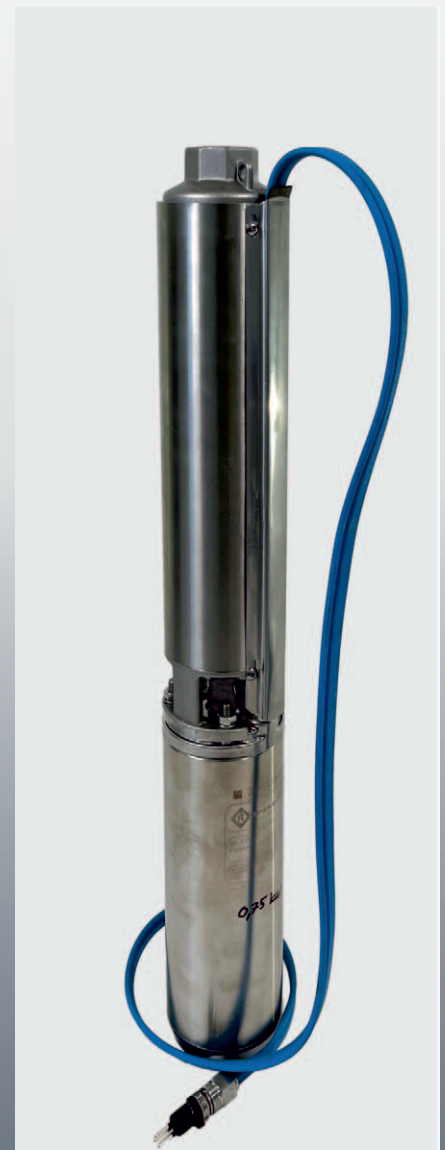
PGT 6" med Franklinmotor